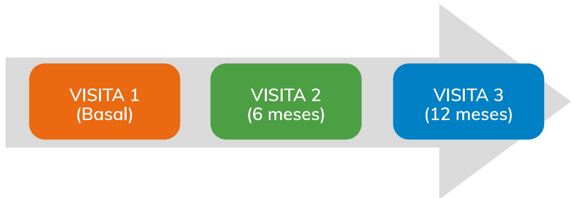
Figura 1. Flujograma de protocolo de registro REAL.